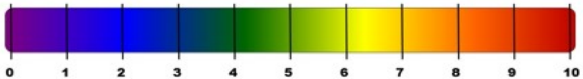
Рис. 2. Визуально-аналоговая шкала для оценки болевого симптома.

Уважаемый пациент, для контроля успешности (эффективности) проводимого лечения, своевременной коррекции болевого симптома просим Вас заполнить шкалу оценки боли по 10-балльной системе.